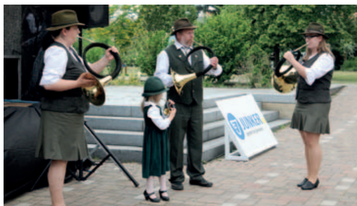
Trubačský sůbor „Šugovsí lesničari“ je rodinným souborem z Medzeva a získává pravidelně nejvyšší ocenění na přehlídkách a soutěžích.