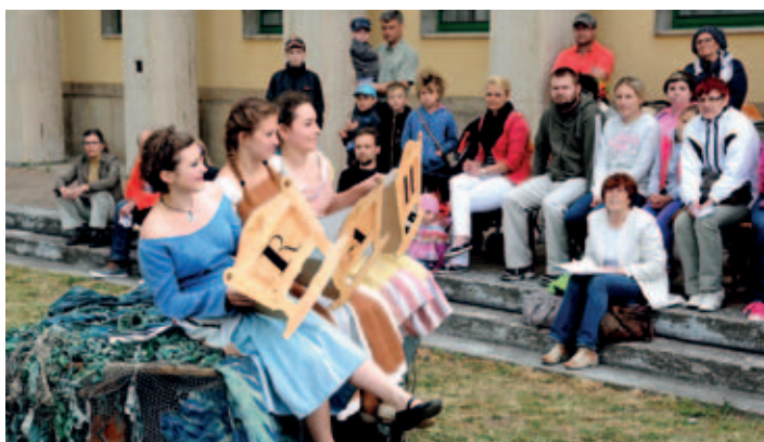
Nedělní dopoledne patřilo dětem a divadelní soubor KD jim zahrál pohádku Princzyna na vdávání.