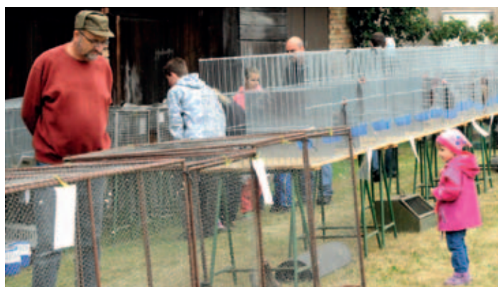
Součástí Dnů Holicka bývá i výstava drobného zvířectva, kterou připravuje holická organizace Českého svazu chovatelů.