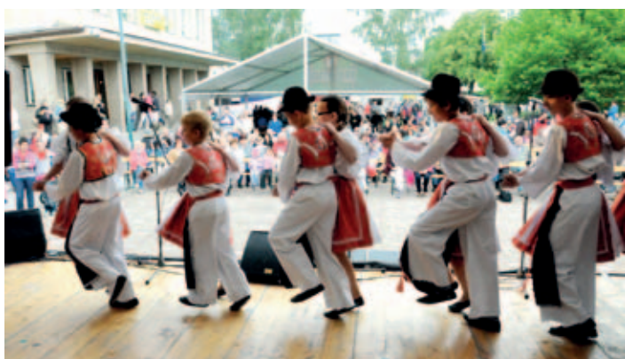
Příjemným zpestřením byl Dětský folklorní soubor Štěpnička ze spřáteleného moravského města Veselí nad Moravou.