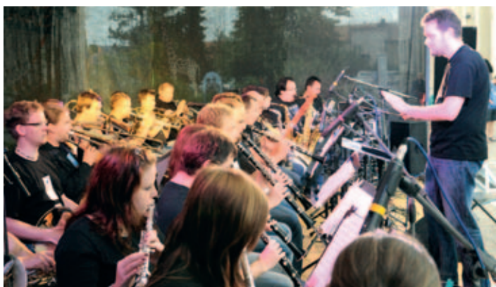
RODEO - rockový dechový orchestr vystoupil na Dnech Holicka poprvé a přednesl největší „rockové pecky“ v netradičním pojetí.