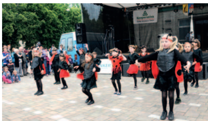
Vystoupení berušek z mateřské školy Staroholická.