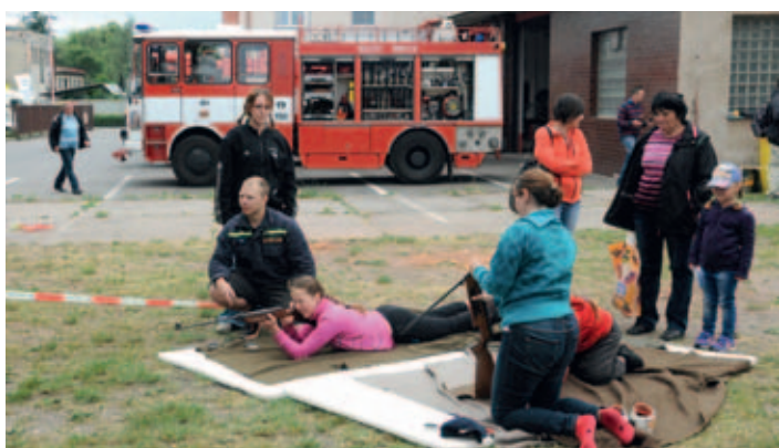
Sbor dobrovolných hasičů Holice uspořádal pro nejmenší návštěvníky Dětský den.