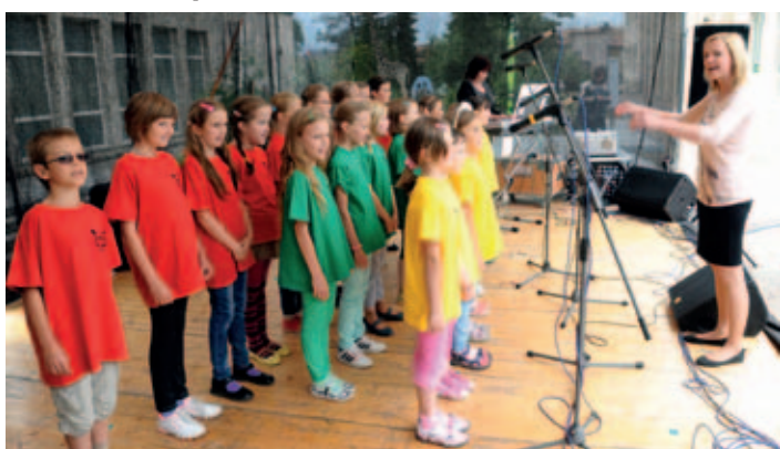
Sobotní odpoledne patřilo souborům mateřských a základních škol, úspěch měl Dětský pěvecký sbor Motýlek z holické ZŠ Komenského.