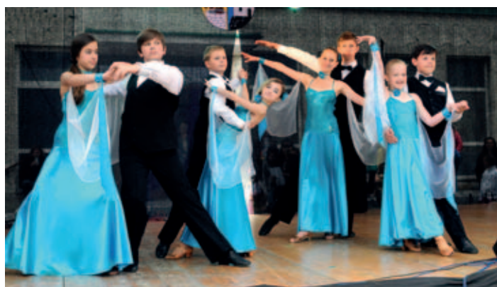
Z vystoupení mladých tanečníků z Tanečního studia Hany Flekové.