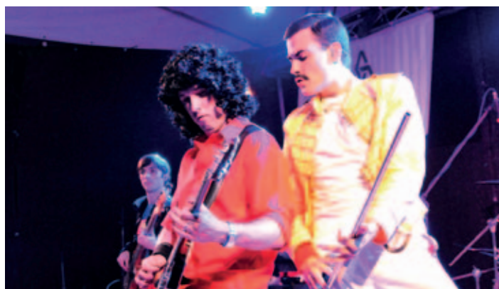
Večer u KD zakončilo vystoupení skupiny QUEENIE-world Queen tribute band a již dle názvu odehrála nejnámější skladby skupiny Queen.