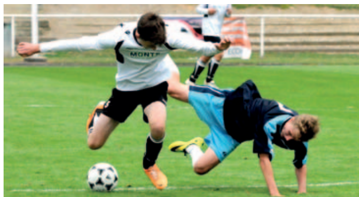
Fotbalový klub SK Holice uspořádal již 44. Ročník Mezinárodního turnaje žáků, v sobotu se utkali fotbalisté domácího SK s týmem z Blanska. Turnaj vyhráli a pohár si odvezli fotbalisté FK Český lev Neštětice.