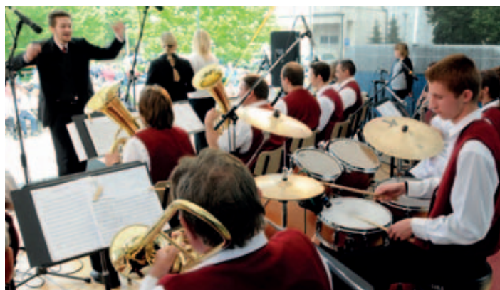
Festival Jaroslava Kocourka – nedělní přehlídka dechových hudeb a vystoupení dechové hudby KD Holice.