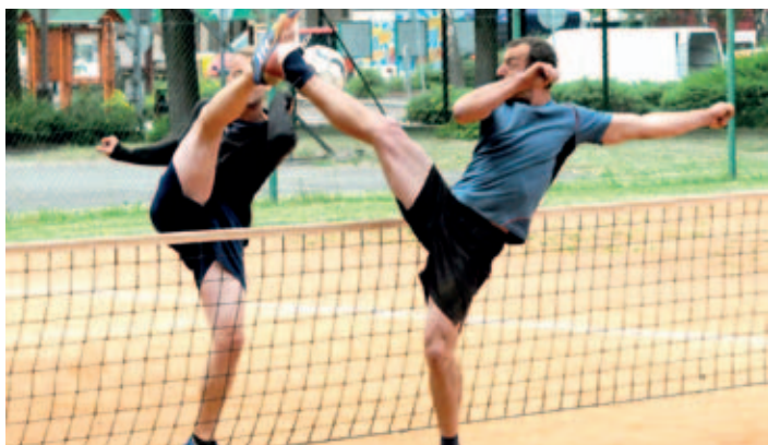
A na „lipáku“ v sobotu probíhal turnaj tříčlenných družstev v nohejbalu.