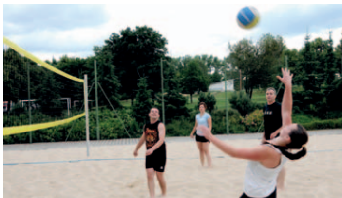
Na hřišti u DDM se odehrál turnaj v plážovém volejbalu smíšených družstev.